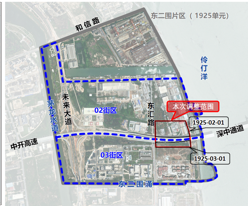
项目在东二围片区的位置